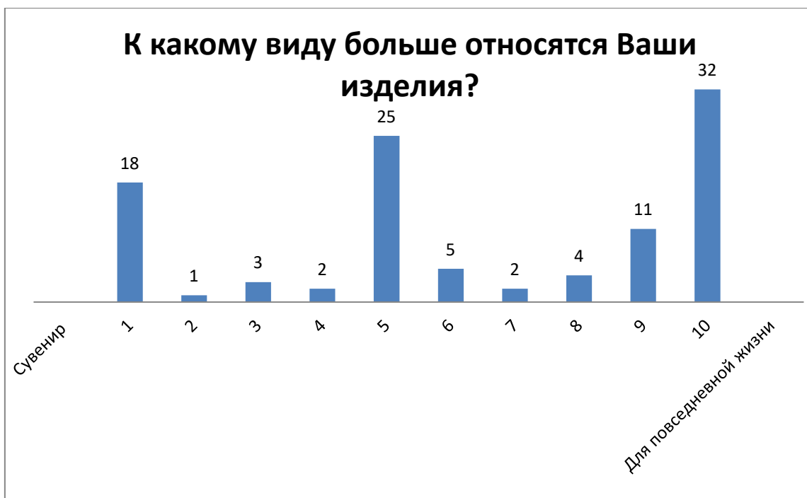
Рис. №5. График ответов: к какому виду больше относятся Ваше изделие?

В ремесленных изделиях преобладает утилитарный характер продукции. Количество ответов о том, что создаваемый продукт более подходит для повседневной жизни в 2 раза больше, чем определения ремесленного изделия как «Сувенир». Так же можно видеть большое количество ответов (25), которые относятся к позиции между «Сувенир» и «Для повседневной жизни». В дополнительных интервью выяснилось, что к категории «между» ремесленники относят полезные подарки (Рисунок №5).