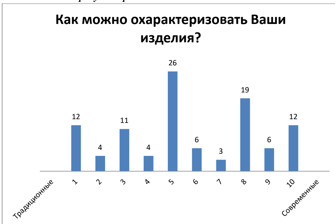
Рис. 1. График ответов: Как можно охарактеризовать Ваши изделия?

Изделия анкетированных практически в равной степени относятся и к современным и традиционным, то есть они находятся на стыке двух определений (Рисунок №1).