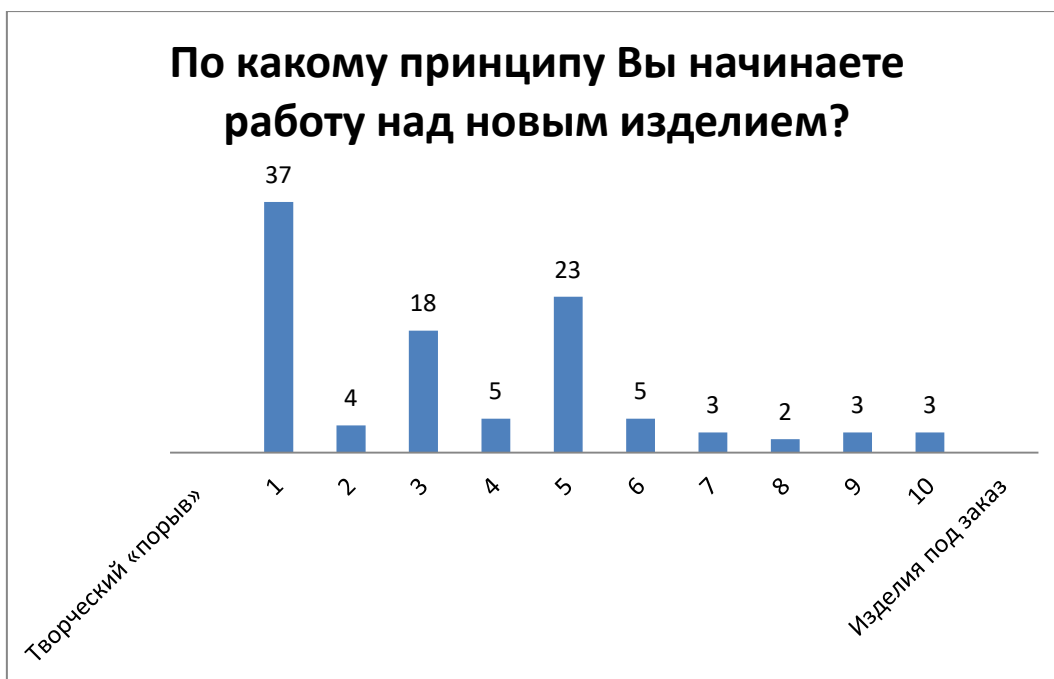
Рис. №4. График ответов: По какому принципу Вы начинаете работу над изделием?

Анкетированные, при создании нового изделия, чаще используют принцип «Творческий порыв». Это обусловлено с одной стороны мотивацией занятий ремесленной деятельностью (на вопрос «Почему вы занимаетесь ремеслом?» ответ «Нравится» получен от 71% анкетированных). Работа на «заказ» является рутинной, неинтересной, иногда невозможной. Если ремесленник хочет увеличить доходы от ремесленной деятельности, то он, с одной стороны, будет улучшать качество своего продукта и вместе с тем изучать рынок, потребителя, точки сбыта продукции. С другой стороны, если говорить в дальнейшем о развитии сферы ремесел как сектора экономической деятельности, стоит обратить внимание на поиск баланса между двумя категориями «творческий порыв» и «изделия на заказ» (Рисунок №4).