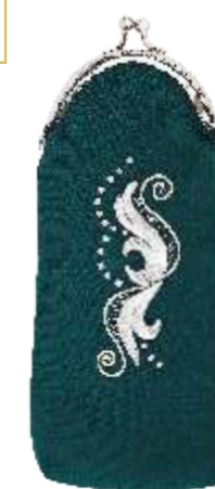
Футляр для очков «Юлия» Исполнитель Ирина Ильина 1 000

Spectacle case «Julia» Author Irina Ilyina