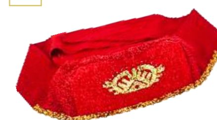
Сорока Исполнитель Ирина Ильина 1 500