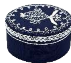
Шкатулка «Море» Исполнитель Ирина Ильина 1 500