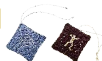
Ароматическая подушечка «Беломорские петроглифы» (подвеска для салона авто) Исполнитель Оксана Сидорова 700

Aromatherapy pillow «The Belomorsk Petroglyphs» (car pendant) Author Oksana Sidorova