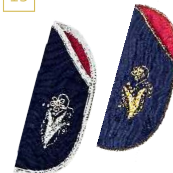
Футляр для очков «Анютины глазки» Исполнитель Ирина Ильина 500

Spectacle case «Heartsease» Author Irina Ilyina