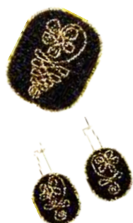
Комплект «Золото Севера» (брошь, серьги) Исполнитель Ирина Ильина 1 000

Jewelry set «The Gold of the North» (brooch, earrings) Author Irina Ilyina