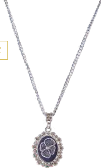
Кулон «На счастье» Исполнитель Оксана Сидорова 500

Pendant «For Luck» Author Oksana Sidorova