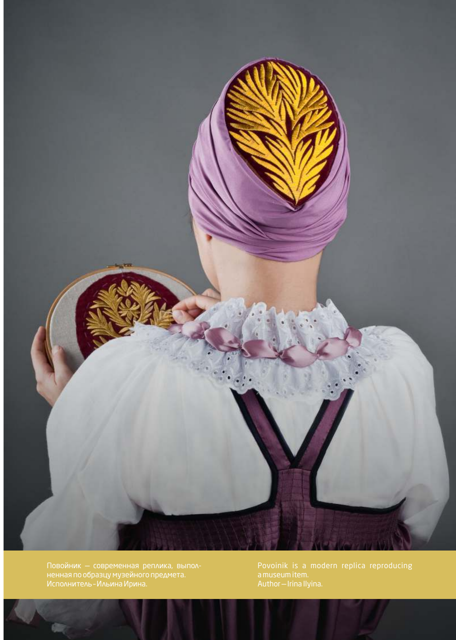
Povoinik is a modern replica reproducing a museum item. Author — Irina Ilyina.