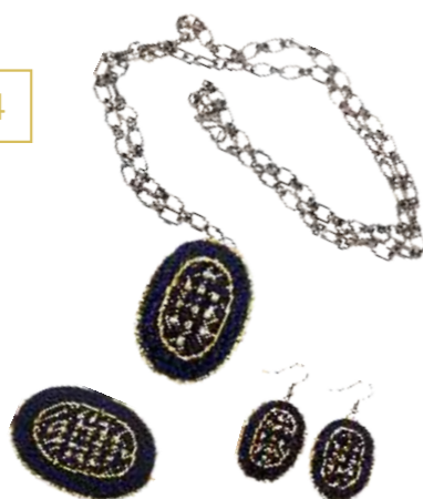
Комплект «Рококо» (брошь, кулон, серьги) Исполнитель Оксана Сидорова 1 500

Jewelry set «Rococo» (brooch, pendant, earrings) Author Oksana Sidorova