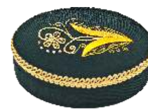
Шкатулка «Лето» Исполнитель Ирина Ильина 1 500